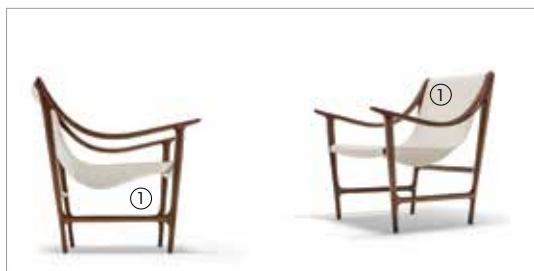
1 Swing 69960 saddle leather milky fin.11